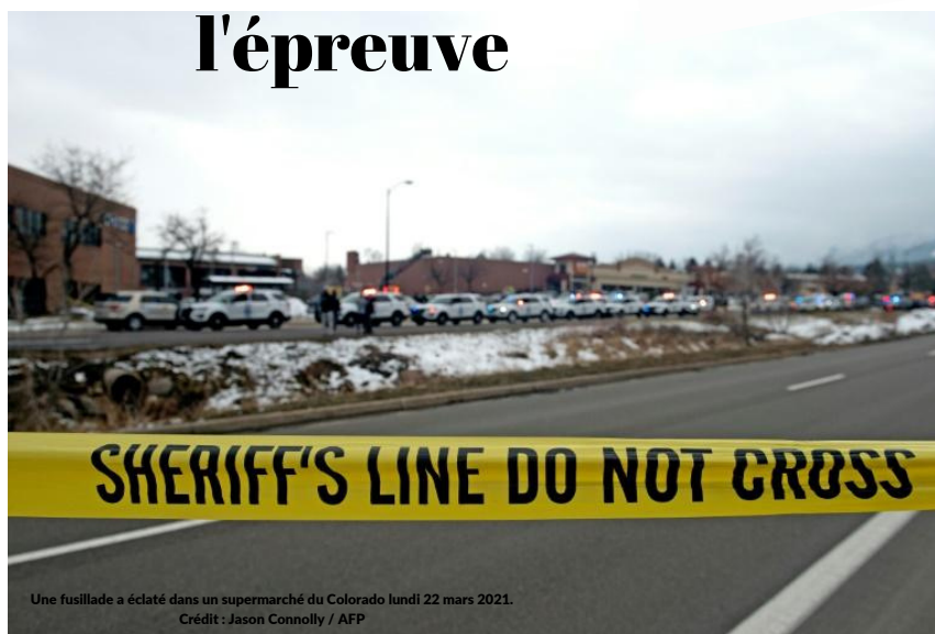
Une fusillade a éclaté dans un supermarché du Colorado lundi 22 mars 2021.

10 victimes, dont un policier, ont été tuées lors d'une fusillade mortelle dans un supermarché à Boulder, aux États-Unis. Les autorités disposent de peu d'informations à propos de l'identité des tueurs, ce qui complique l'enquête. En seulement 3 mois au pouvoir, à la Maison Blanche, Joe Biden doit déjà faire face à plusieurs atrocités qui ont ravagé l'État, avec plus de 2 attaques en 5 jours. Comment le président des États-Unis va-t-il pouvoir apporter la paix aux citoyens ? page 7