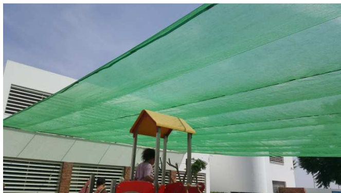
Les brise soleil bâtiment B