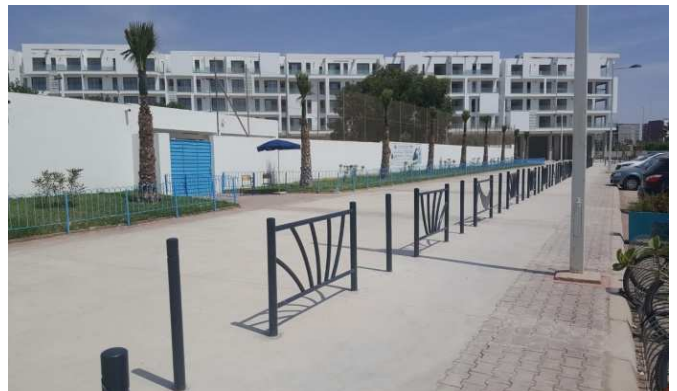
L'entrée rehaussée du collège lycée

Les aménagements du trottoir primaire et les jardins