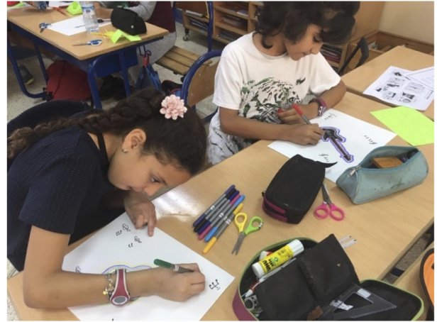
Les CE1 à l'Atlas Kasbah

Le but de ce voyage est de faire découvrir aux élèves la vie dans un environnement proche de chez eux mais différent. Par ailleurs, les activités dans l'écolodge permettront de faire comprendre aux élèves qu'on peut avoir des gestes citoyens et écologiques dans la vie quotidienne.