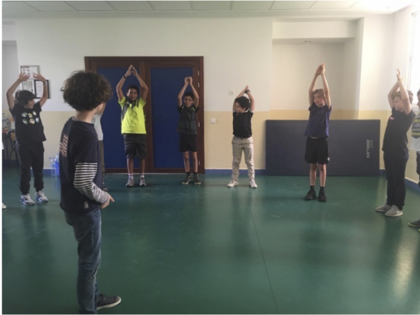
Flash Mob des CM1

Le but de ce voyage est de faire découvrir aux élèves la vie dans un environnement proche de chez eux mais différent. Par ailleurs, les activités dans l'écolodge permettront de faire comprendre aux élèves qu'on peut avoir des gestes citoyens et écologiques dans la vie quotidienne.