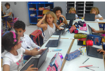
L'Espace Numérique de Travail au CE2

Leur relation aux savoirs se trouve améliorée par l'auto évaluation et la faculté de revoir une notion sans limitation. Enfin, l'implication des élèves est encouragée par le numérique.