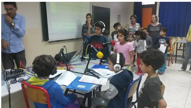
Séance d'enregistrement radio avec des élèves du CE1 et CE2

La troisième et dernière émission de l'année scolaire s'intéressera particulièrement aux classes trois langues.