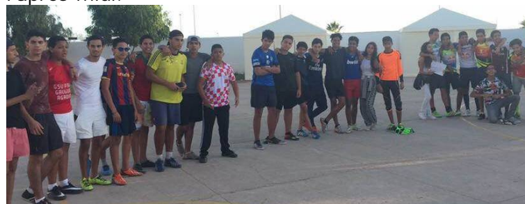
Le Proviseur adjoint

Comme chaque trimestre, les élèves du CVL ont organisé un interclasse de foot au lycée. Les supporters nombreux ont encouragé les équipes le samedi 15 octobre jusque tard dans l'après-midi.